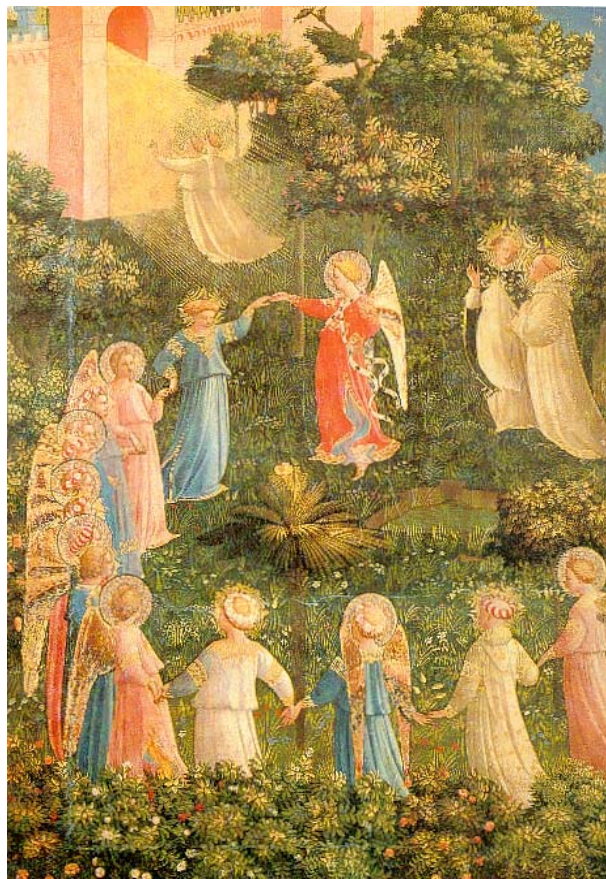
Fra Angelico LE JUGEMENT DERNIER (DETAIL) Musée de Saint Marc (Florence)