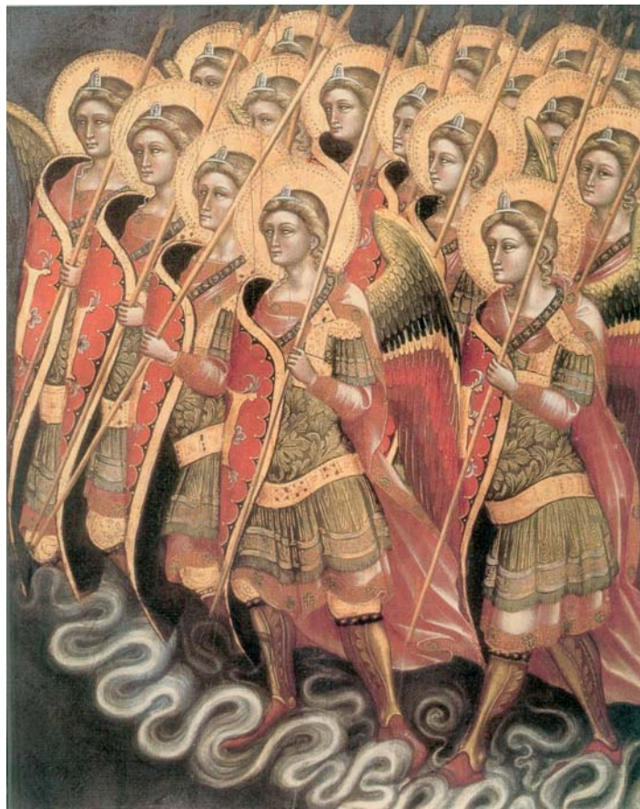
La Milice Céleste